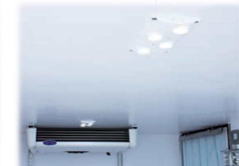
Світлодіодний світильник з перемикачем всередині кабіни