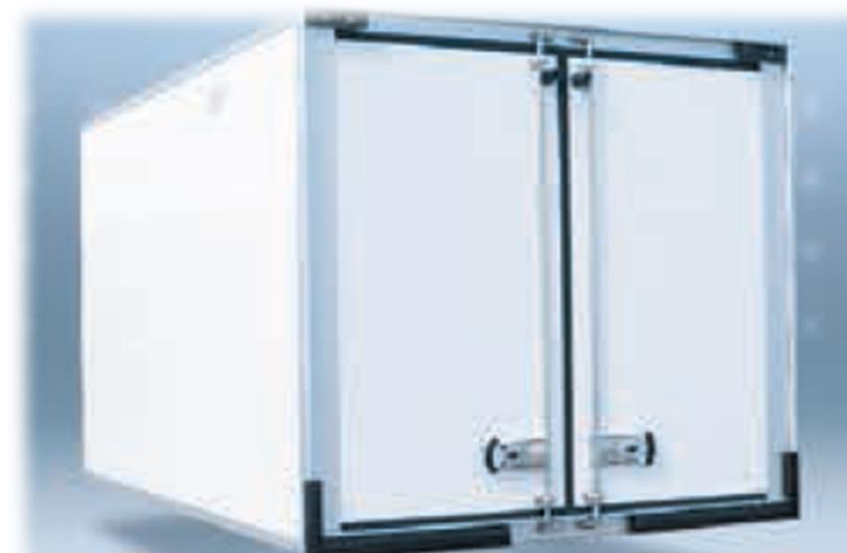
Композитні панелі (харчовий гелеобразний шар - поліефір - поліуретан), оснащені алюмінієвими вставкам