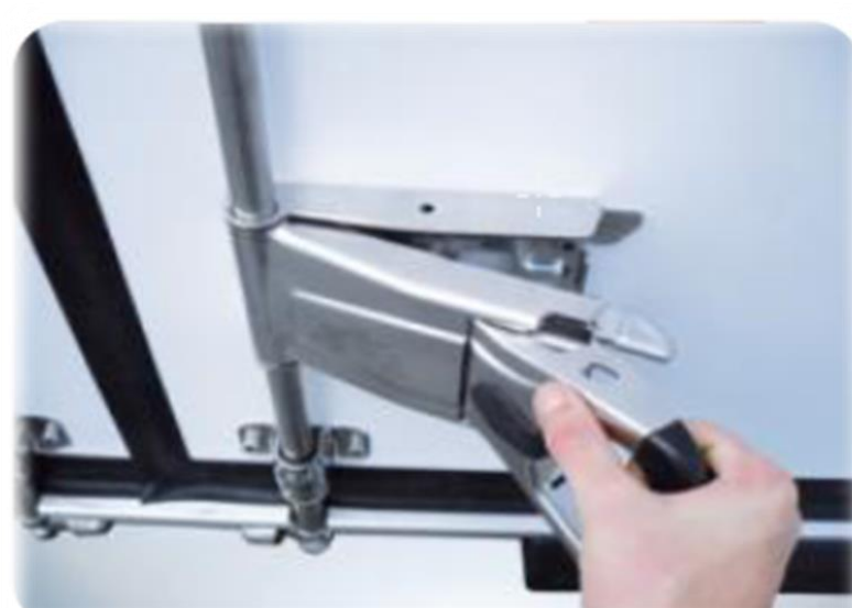
Нова ручка "Easy Handle" з одним рухом, на задніх дверях